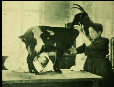
Feeding with goats milk in the 19th century