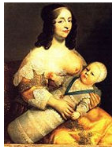
Solkongen med sin amme